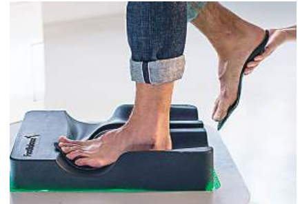
6. Her bir ortopedik tabanlık tek tek ayağı ve ihtiyaca özel şekillendirilir. Mükemmel uyum için son bir kez daha sağlık uzmanı tabanlıkları kontrol eder.