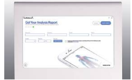
4. Kişiyeye özel ayak analiz raporu e-posta aracılığıyla hastaya gönderilir.