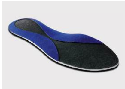
7. Gerektiğinde, kişiyeye özel kama eklenecektir.