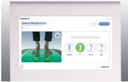
3. FitPro yazılımıyla ayak ve ayak bileklerinin fotoğrafı çekilir. Ayak ve taban analizi yapılır.