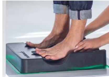
5. Isıtılmış ortopedik tabanlıklar her bir ayağı özel şekillendirilirken doğru ayak dizilimi korunur.