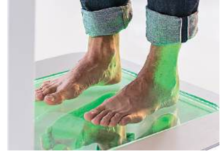
2. Ayak ve taban analizi podoskop üzerinde yapılır.