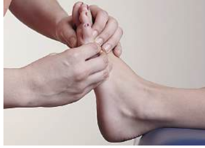
1. FootBalance sağlık uzmanı gözlem ve elle ayağı muayene eder.

Ayrıca, FootBalance işinizin gün geçtikçe daha başarılı olmasını sağlamak için ilave takip faaliyetleri yürütür ve bu konuda size destek olur. İş ortaklarımız; Fizik Tedavi Merkezleri, Ortez Protez Merkezleri, Hastaneler, Ortopedi ve Fiziksel Rehabilitasyon Klinikleri, Sporcu Sağlığı Merkezleri, Ayak Sağlığı Merkezleri, ilgili hekimler, fizyoterapistler ve podologlardır. FootBalance kioskları bu merkezlerde hizmet vermektedir. Sağlık uzmanları sistemin işleyişi ve tabanlığın oluşturulması konusunda eğitilmiştir.